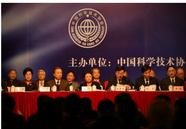
科协副主席白春礼在发布会上做“学科发展进展”报告