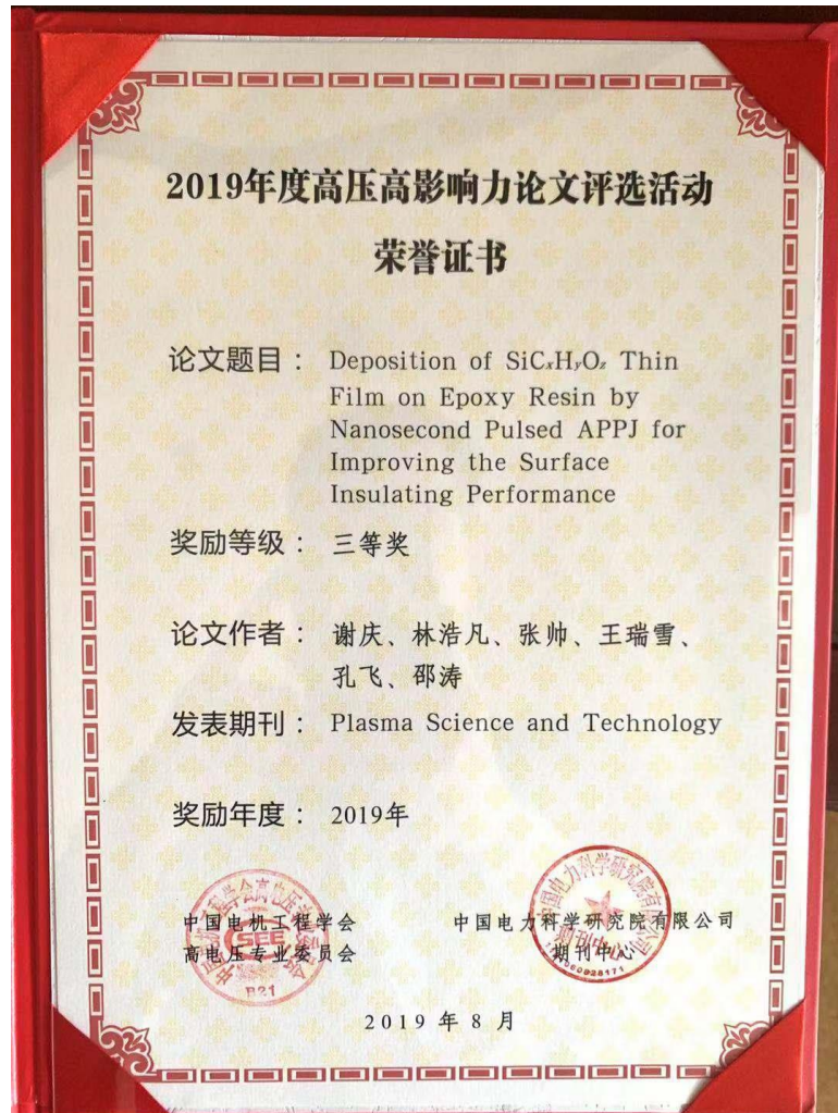
图 4. PST 发表的一篇文章被评为 电机工程学会高电压专业委员会 2019 年度高压高影响力优秀论文