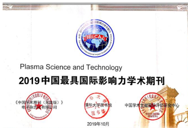
图 2. PST 荣获 2019 中国最具国际影响力学术期刊称号