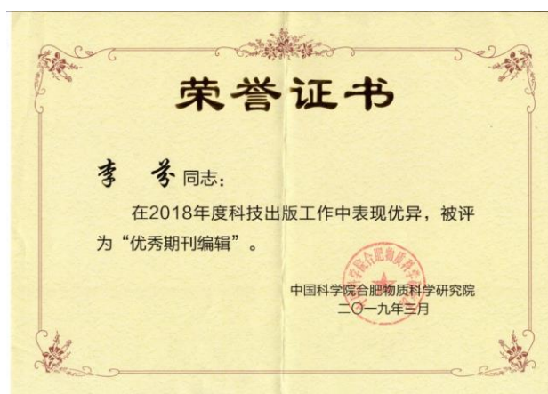
图 3. 李芬被评为中国科学院合肥物质研究院 2018 年优秀期刊编辑