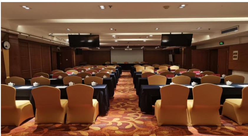
图 6 会议室